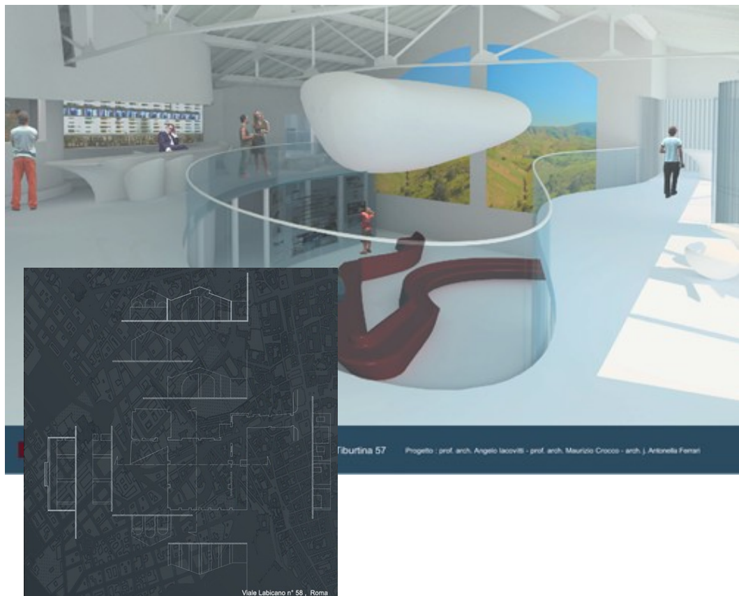
Fig. 1 Esempio di progetto di ristrutturazione (Antonella Ferrari, Tesi di laurea)

A tal proposito, anche su indicazione del III Municipio, sono stati individuati alcuni spazi che potrebbero accogliere il WAM, per i quali sono state già approntate alcune ipotesi progettuali di trasformazione e recupero.